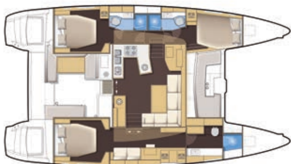
VERSION 3 CABINES 3 CABIN VERSION 3 KABINEN-VERSION 3 CAMAROTES VERSIONE 3 CABINE