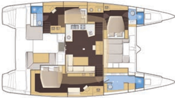
VERSION 3 CABINES 3 CABIN VERSION 3 KABINEN-VERSION 3 CAMAROTES VERSIONE 3 CABINE