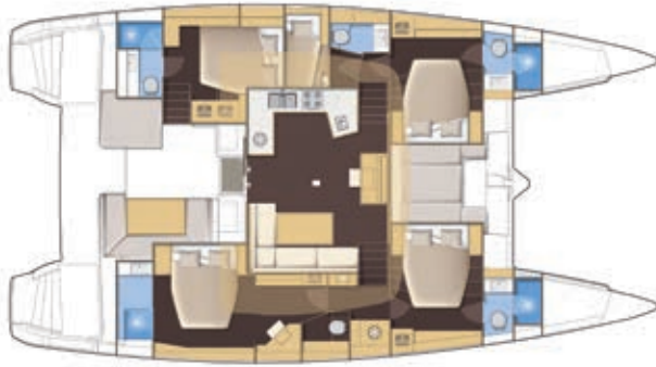
VERSION 5 CABINES 5 CABIN VERSION 5 KABINEN-VERSION 5 CAMAROTES VERSIONE 5 CABINE