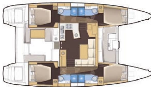
VERSION 4 CABINES 4 CABIN VERSION 4 KABINEN-VERSION 4 CAMAROTES VERSIONE 4 CABINE