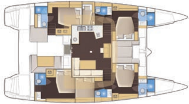
VERSION 6 CABINES 6 CABIN VERSION 6 KABINEN-VERSION 6 CAMAROTES VERSIONE 6 CABINE