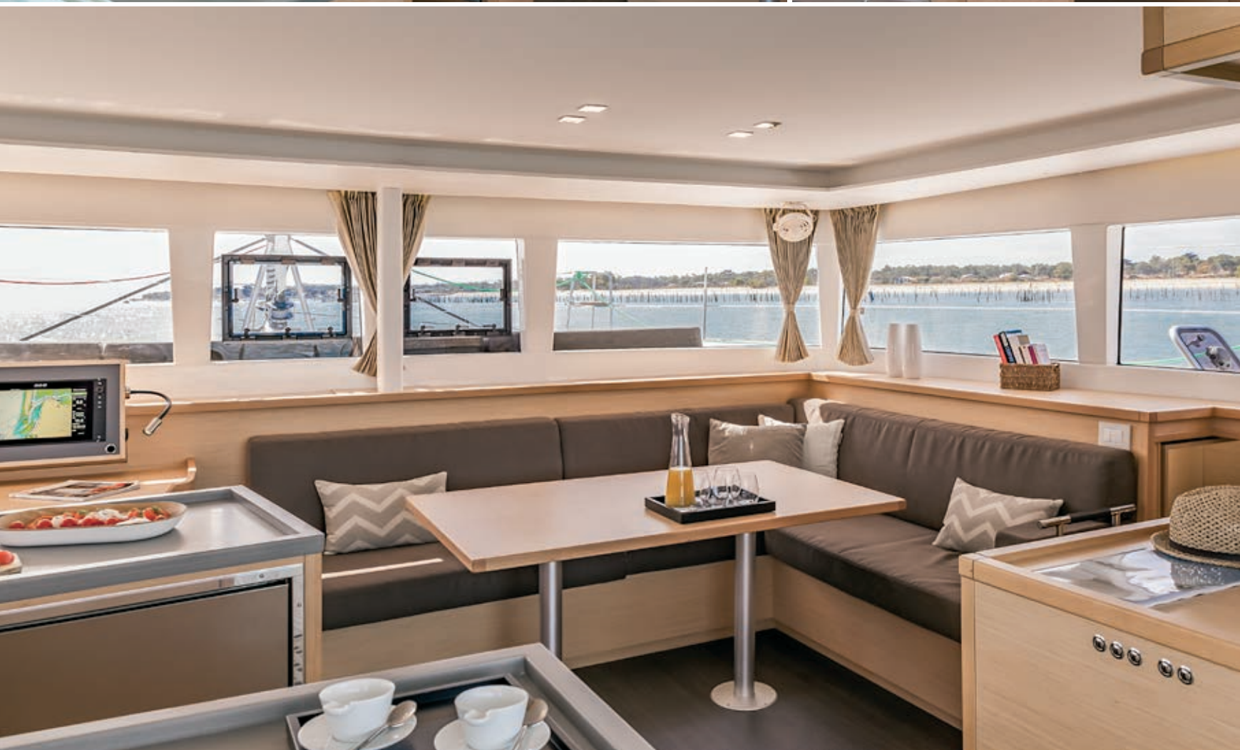
Vue à 360° sur l'extérieur même dans le carré.